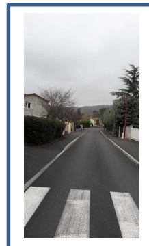
Rue de la Clide