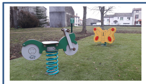
Jeux Parc Jay 2