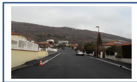
Rue de Brassillat