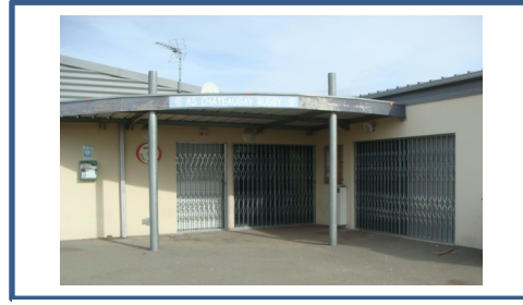
Travaux grilles rugby .JPG