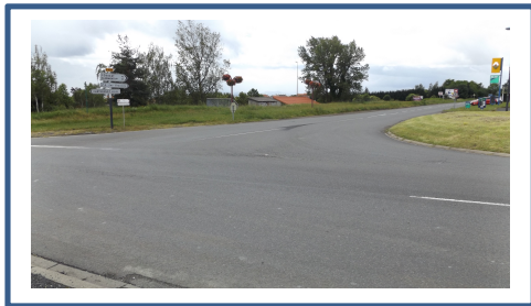
Carrefour Entrée Ouest_1_Avant