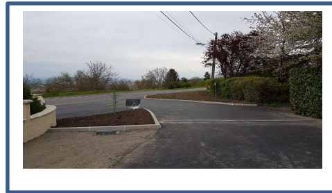
Bois de Queuille