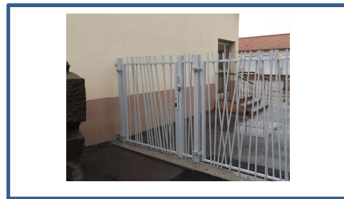
Portail école élémentaire