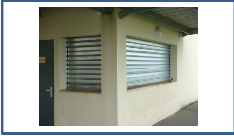
Travaux grilles foot.JPG