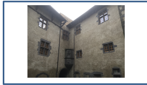
Travaux fenetres chateau apres.JPG