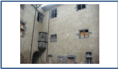
Travaux fenetres chateau avant.JPG