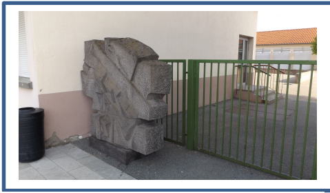
Portail école élémentaire avant