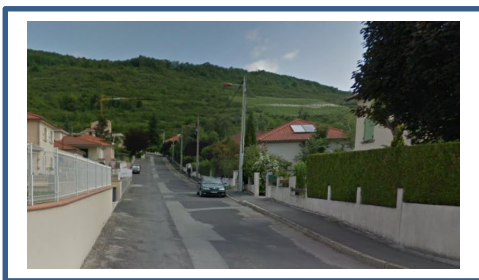
Rue de Brassillat avant