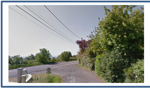
Bois de Queuille_Avant