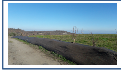
Amenagement site table d'orientation_2.jpg

Terrassement et pose d'un merlon au stade des Cluzelles : 4.320 euros