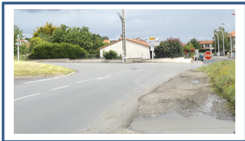
Entrée Ouest_D402 avant