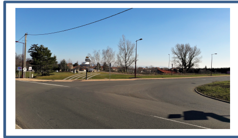
Carrefour Entrée Ouest_1.jpg