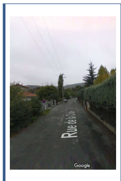
Rue de la Clide avant2