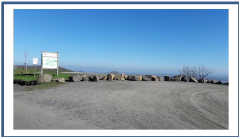
Amenagement site table d'orientation_1.jpg