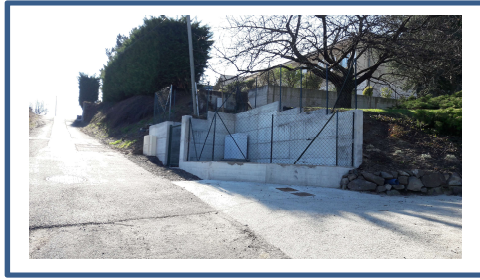
Chemin des Duyaux_1