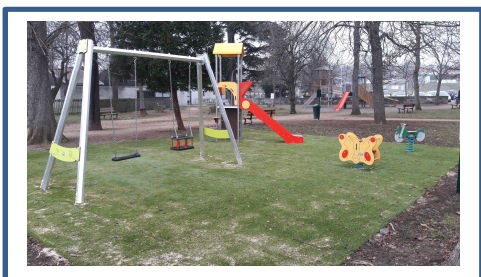
Jeux parc Jay_1