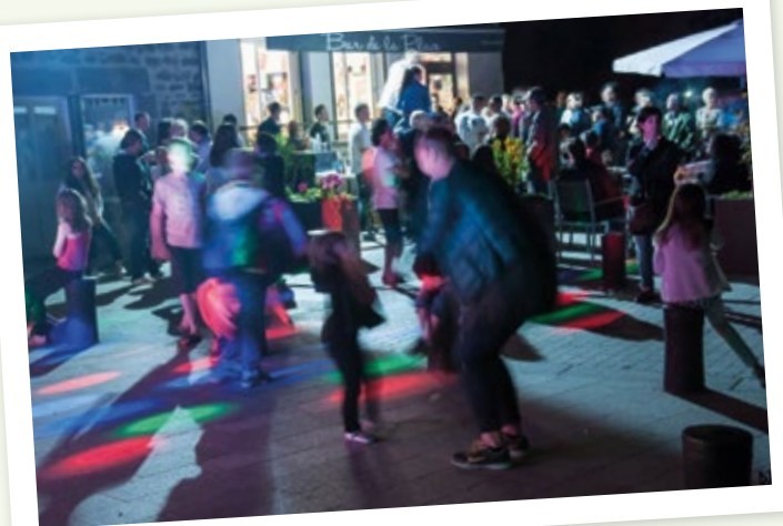
Près d'un demi-siècle à écumer les scènes d'Auvergne avec son petit orchestre battit dans les années 70. Parcourant les routes de France et de Navarre avec son orchestre devenu un des plus grands de France, celui qui a connu en solo la renommée de son tube « les trottoirs de Manille », Bernard Becker, l'enfant du pays, est revenu pour Châteaugay en fête interpréter ses meilleurs tubes et faire danser les châteaugayres.