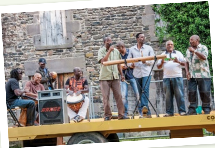
Un peu d'exotisme à l'heure de l'apéro avec le Groupe Antillais... De quoi danser la biguine et faire rêver des îles