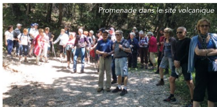
Promenade dans le site volcanique

61 baladeurs ont participé à ce séjour du 23 au 28 mai dans une ambiance amicale et conviviale avec des spectacles riches en couleurs, des soirées flamenco et des balades culturelles guidées à travers le parc volcanique de la Garrotza classé au patrimoine mondial, avec la descente au creux du volcan de Santa-Margarida à 682 m.