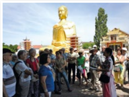
Devant BOUDDHA avec notre guide