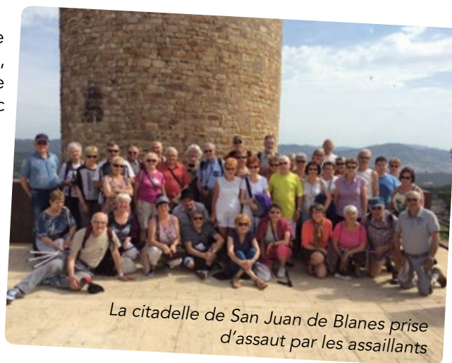
La citadelle de San Juan de Blanes prise d'assaut par les assaillants