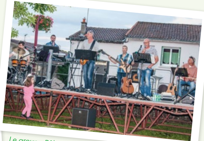
Le groupe Pêle-mêle a pris la relève à l'heure du bar-becue géant. Ce groupe de variété des années 80 a proposé les plus grands tubes de cette période... Du swing... encore du swing