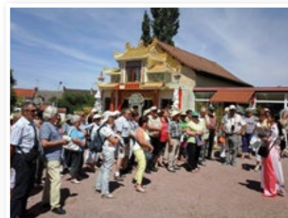
Le 06 juillet, une journée en Indochine - 61 adhérents ont participé et visité la ville Indochinoise de Noyant d'Allier, petite ville de l'Allier qui a accueilli après la guerre d'Indochine des centaines de rapatriés