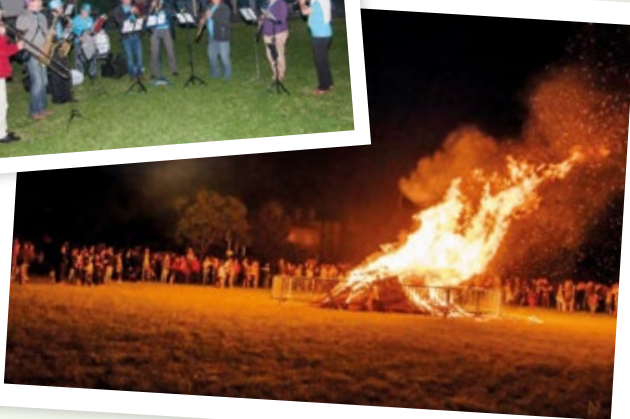
C'est l'heure du feu de la Saint-Jean, animé par notre banda locale « 2 mesures pour rien ». Banda du sud ouest, musique traditionnelle, ce groupe d'amis musiciens pour le plaisir, a su mettre de l'ambiance autour du feu !