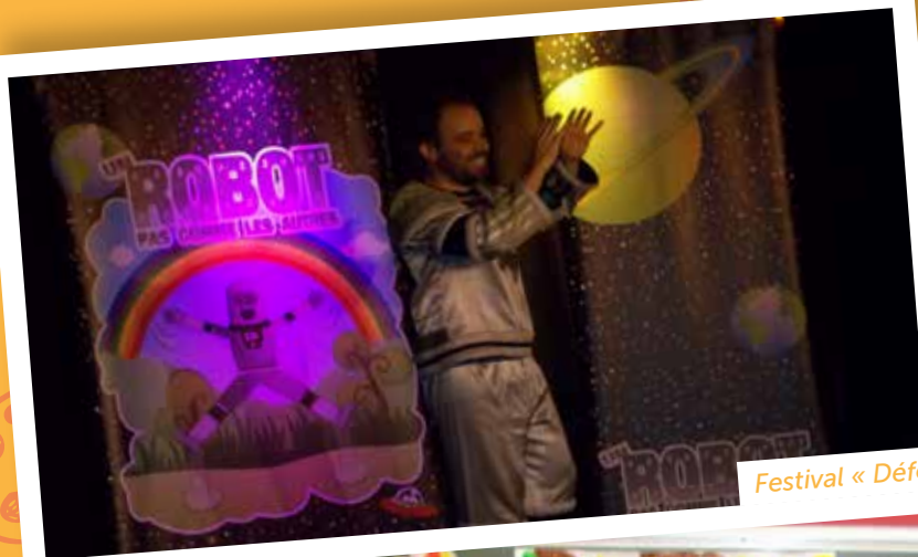
Festival « Défonce de rire »