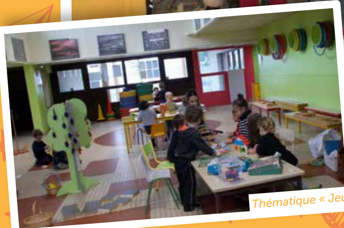
Thématique « Jeux en bois »

➔ 06 08 00 67 15 • service-enfance-jeunesse@chateaugay.fr