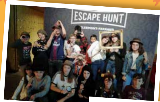
« Escape Hunt »