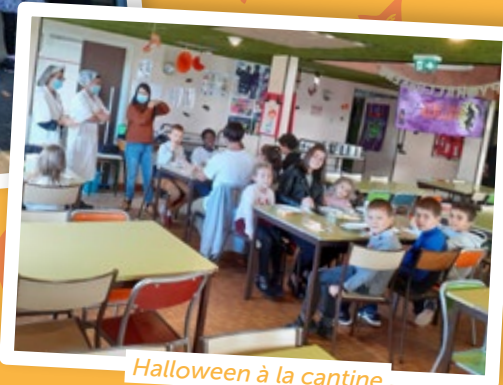
Halloween à la cantine