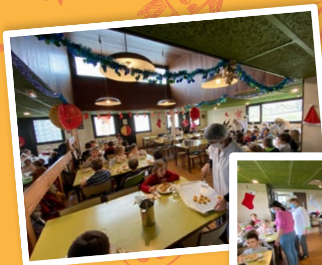
Noël à la cantine