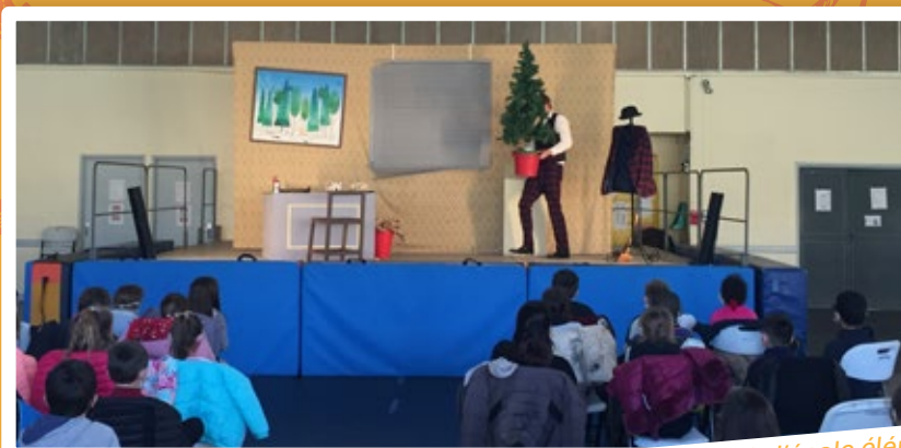
Spectacle de Noël de l'école élémentaire