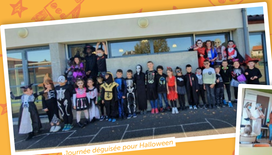
Journée déguisée pour Halloween