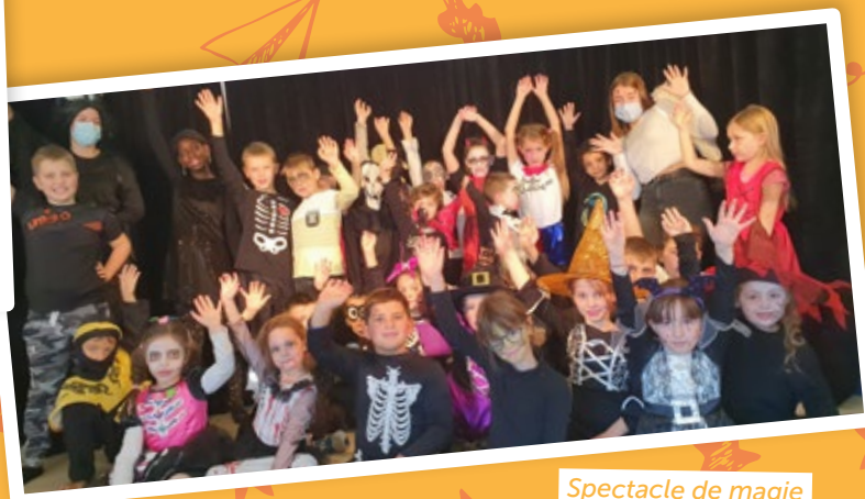
Spectacle de magie