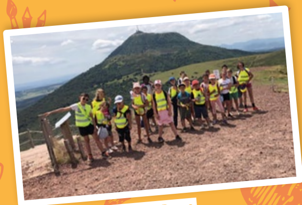
Balade au Puy de Dôme