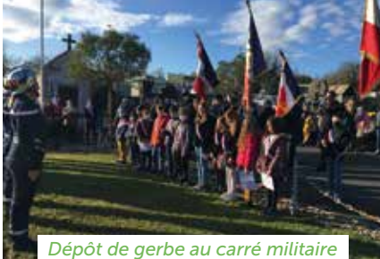
Dépôt de gerbe au carré militaire

Une foule nombreuse, dont des élèves de l'école élémentaire, était au rendez-vous pour célébrer le 98 e anniversaire de l'armistice de 1918.