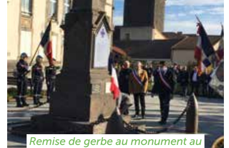
Remise de gerbe au monument aux Morts, place Lucien-Bayle