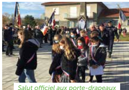
Salut officiel aux porte-drapeaux