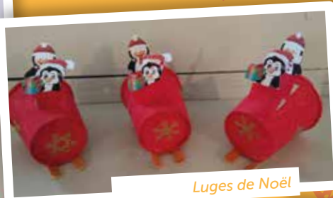
Luges de Noël