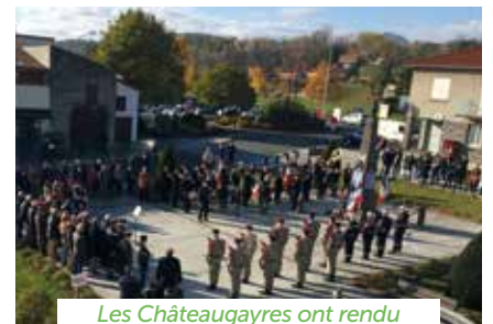
Les Châteaugayres ont rendu hommage aux morts pour la France.