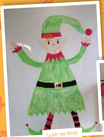
Lutin de Noël