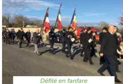
Défilé en fanfare