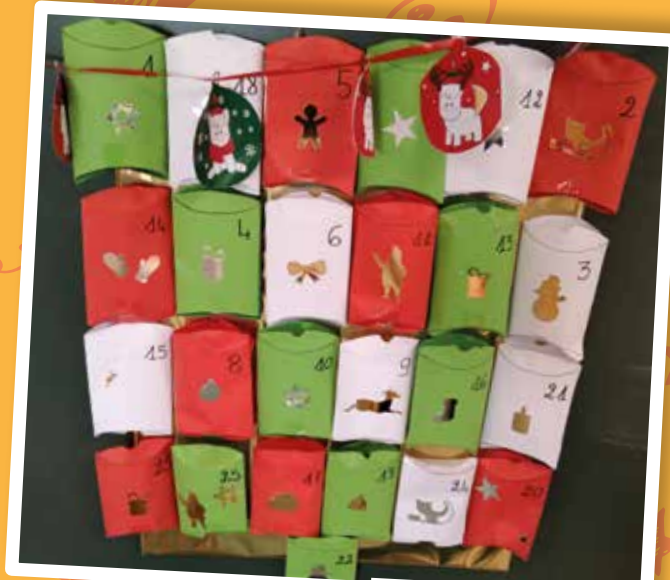
Calendrier de l'avent

➔ 06 08 00 67 15 • service-enfance-jeunesse@chateaugay.fr