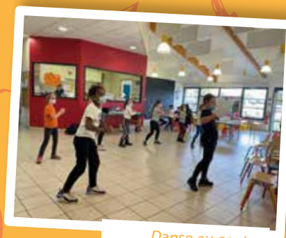
Danse au centre

➔ 04 73 87 40 10 • service-enfance-jeunesse@chateaugay.fr