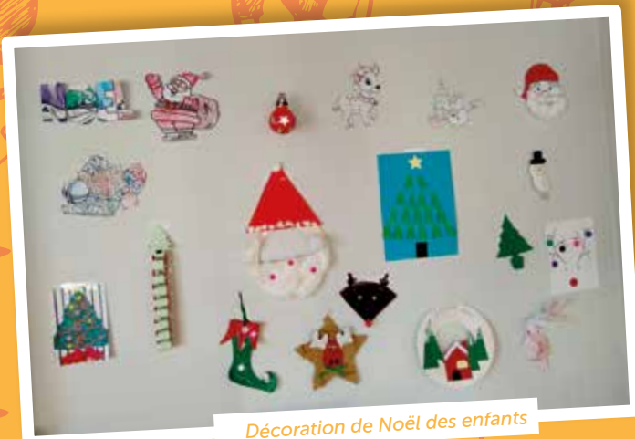
Décoration de Noël des enfants