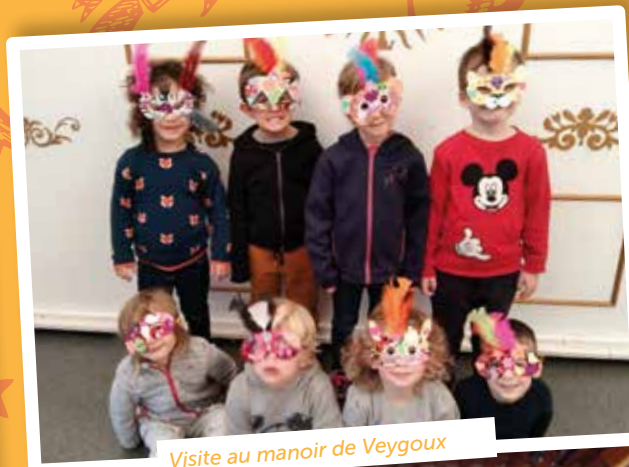
Visite au manoir de Veygoux