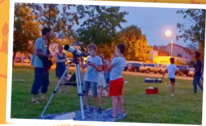
Initiation à l'astronomie

➔ 04 73 87 40 10 • service-enfance-jeunesse@chateaugay.fr