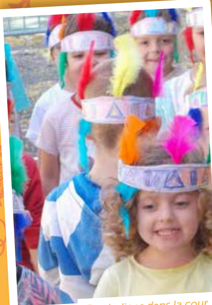
Des indiens dans la cour