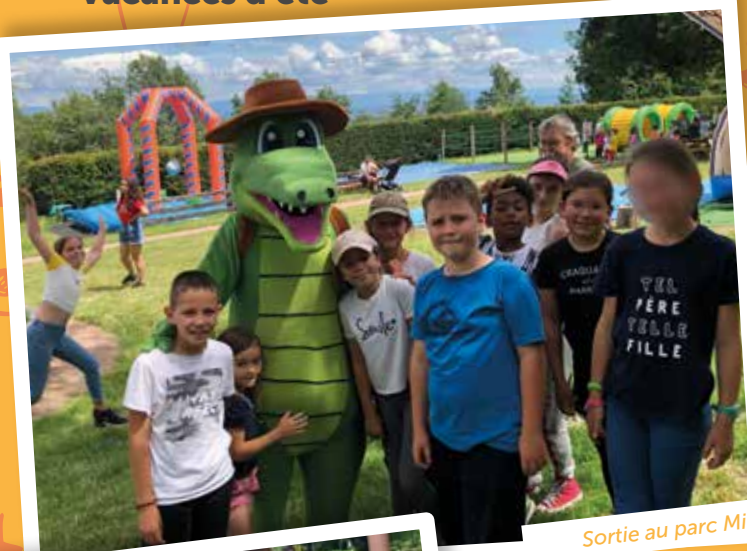
Sortie au parc Mirabelle