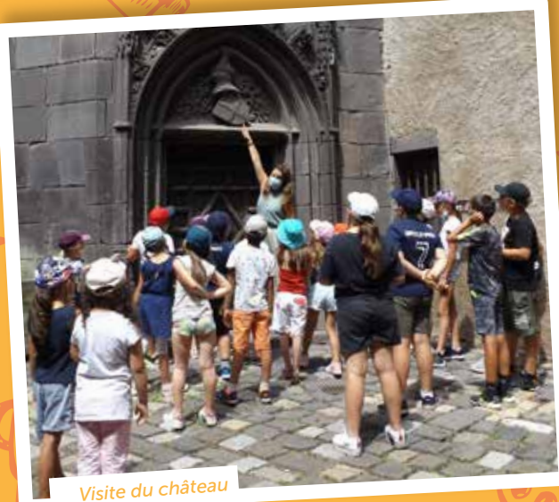
Visite du château