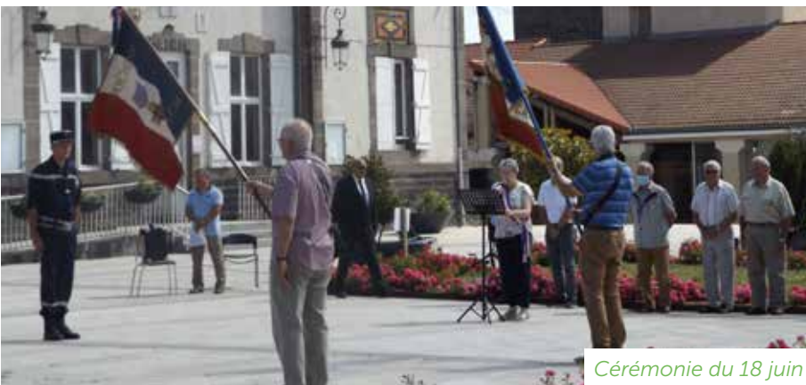
Cérémonie du 18 juin

La Marseillaise et le Chant des partisans ont retenti au cours de la cérémonie, rendant l'atmosphère solennelle et remplie d'émotion.