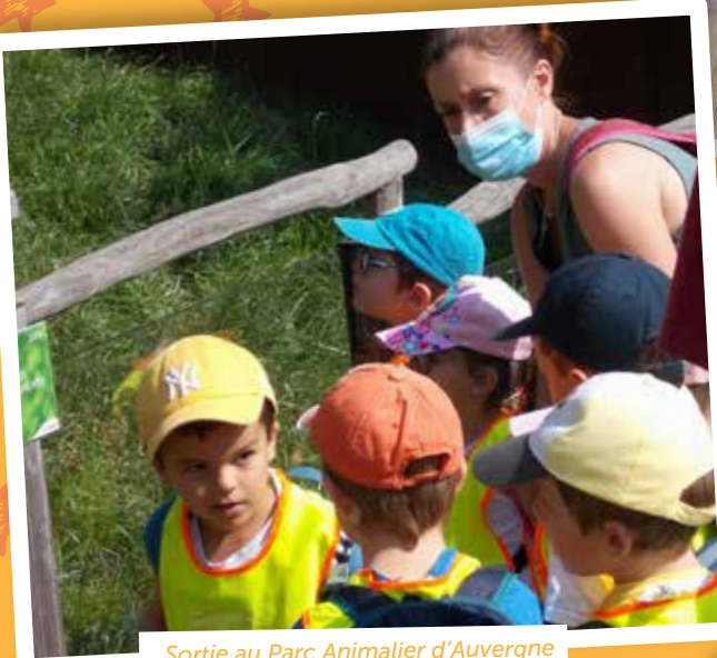
Sortie au Parc Animalier d'Auvergne