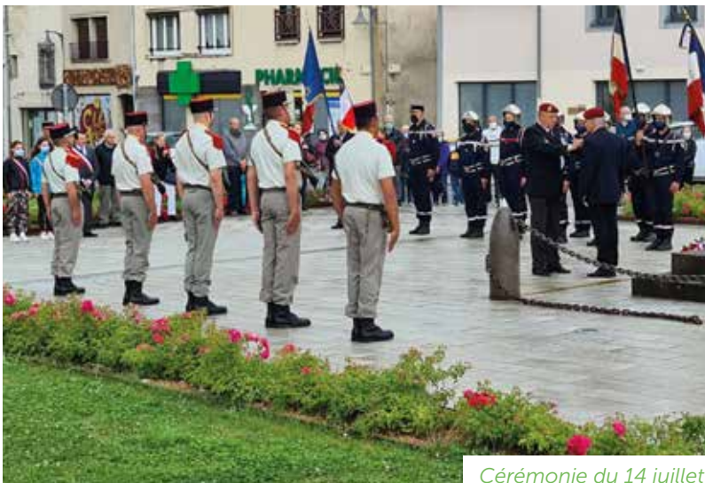
Cérémonie du 14 juillet

Pour clôturer cette cérémonie, la municipalité a offert le traditionnel vin d'honneur dans la petite salle Jacques-Escuit.